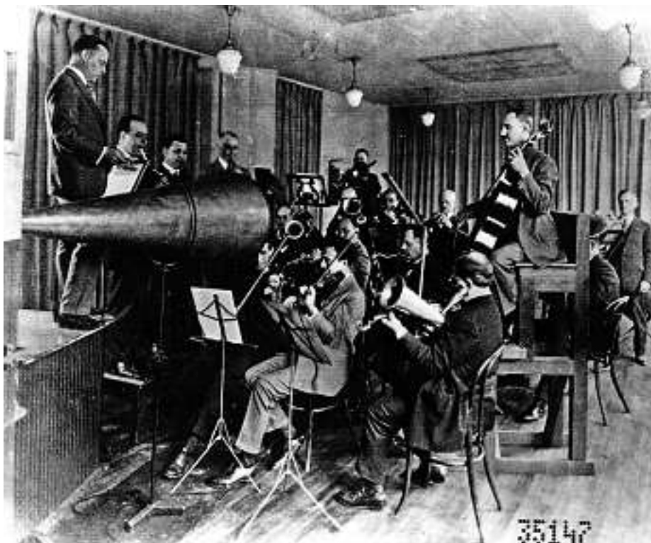
«The musicians gathered in front of the large recording horn, which funneled their sounds to the master wax disc»

» Christoph Zimmermann, Hard-/Software-Entwicklungsingenieur