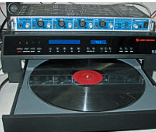
Laserplattenspieler LT2XA von ELP mit RME Fireface und 12-Zoll-Schellack-Platte

Ab den 1910er-Jahren war dann vor allem die Schellackplatte mit 78 min -1 in Seitenschrift das dominierende Format. Der Durchmesser lag bei 25 oder 30 cm. Das Produktionsende der Schellackplatten in Europa war im Jahr 1961.